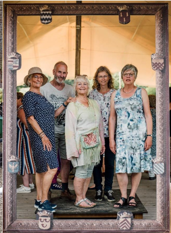
Moestuinvrijwilligers in zomers chique tijdens de zomerborrel. Dat is even heel anders.