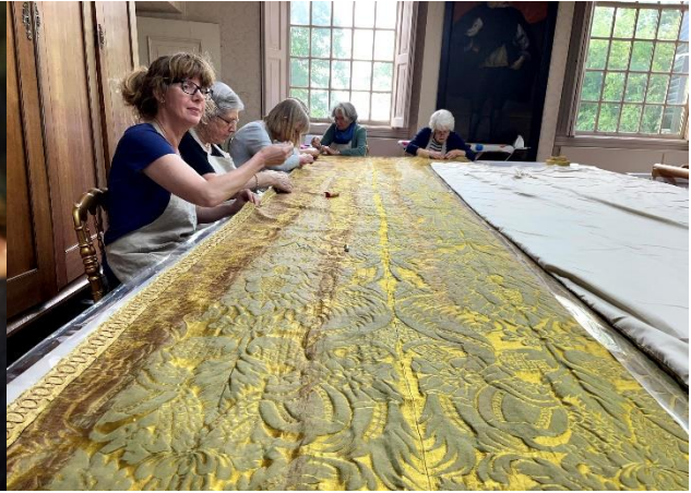
Sommige vrijwilligers werken in groepsverband maar lang niet iedereen ziet zijn werkgroepgenoten regelmatig