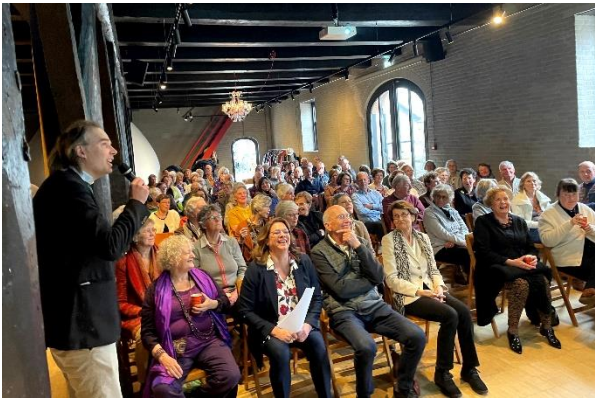
De (scholings-)lezingen zijn naast informatief ook heel gezellig.