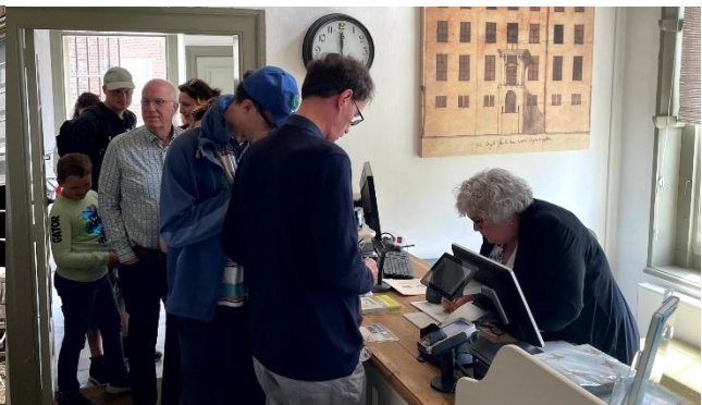
Drukke dagen bij de kaartverkoop zijn weer helemaal terug