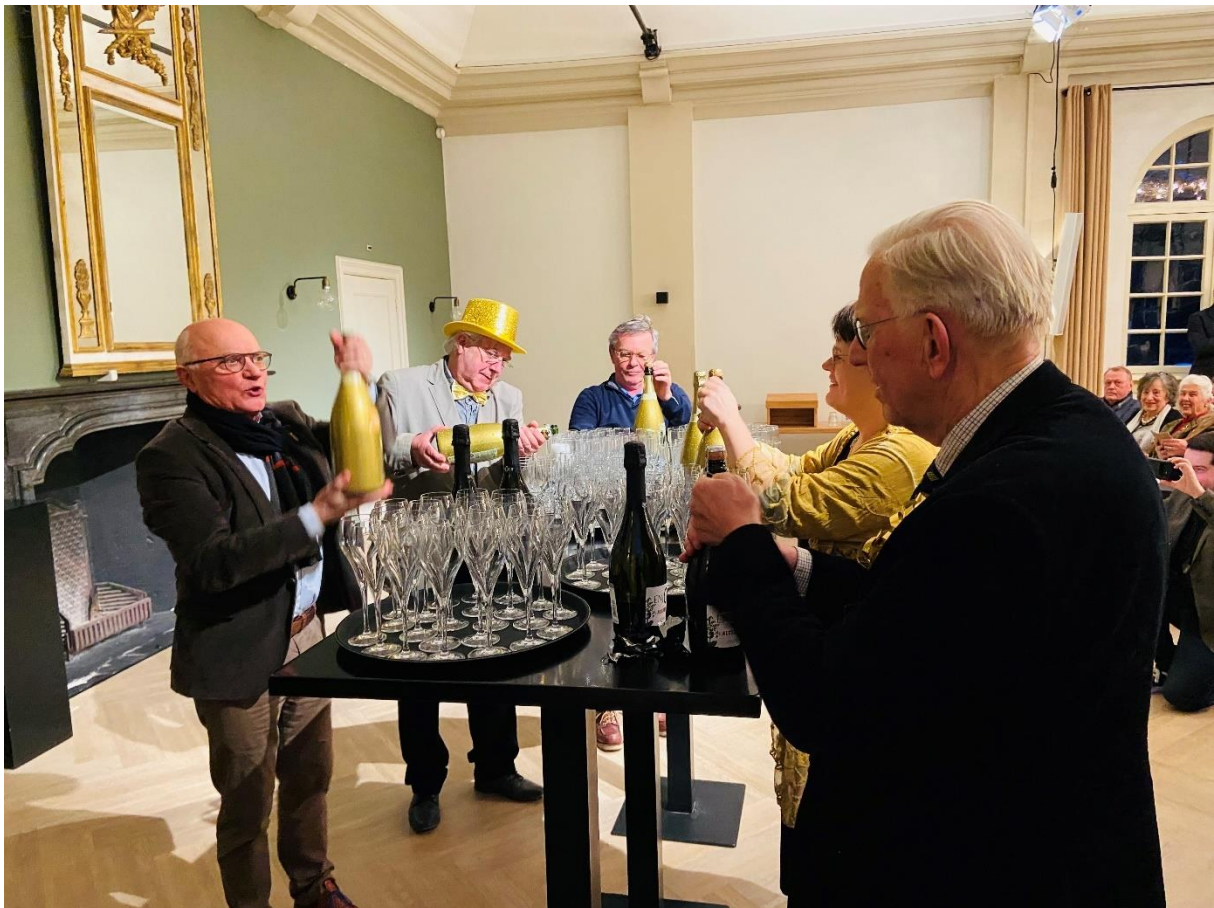
Nieuwjaarsborrel met 150 van de 240 vrijwilligers. Thema: 'Goud'