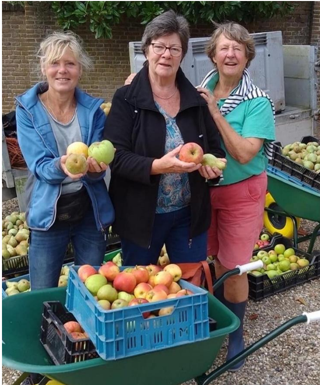
Helpen bij andere werkgroepen gebeurt steeds vaker. Zoals een ochtend buiten fruit plukken door de winkeldames.