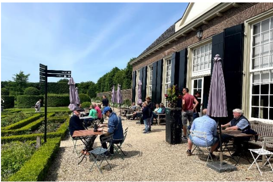
Met de eerste zon is het goed toeven op het terras