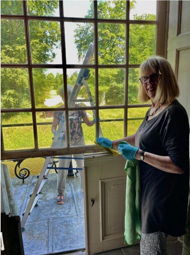
Wekelijks onderhoud aan de collectie door de nieuwe vrijwilligersgroep Collectiebehoud.