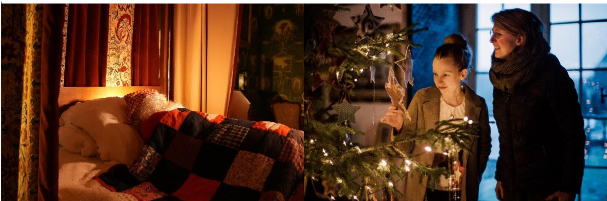
Na goedkeuring van het Koninklijk Huis mocht de Kerstman in het Koningsbed logeren.