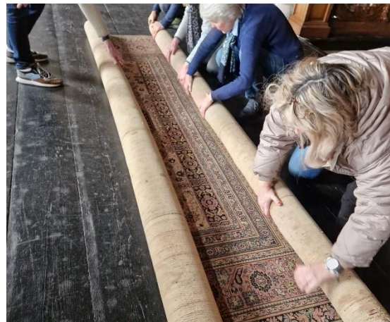
Collectiebehoud inspecteert op plaagdieren