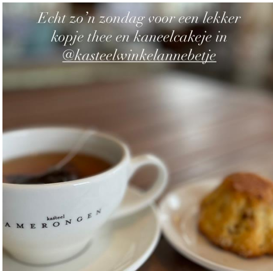
Lokaal gebakken lekkers bij een heerlijke kop thee in de Oranjerie

Onze kasteelwinkel kende in 2023 een bijzonder goed jaar met een aanzienlijke omzetstijging. Er is enorm hard gewerkt door vrijwilligers die dagelijks de verantwoordelijkheid op zich nemen om de kaartverkoop te realiseren, VVV-informatie te geven, thee, koffie en ijs te verkopen en te zorgen voor een bijzonder smaakvol winklassortiment. Van (historische) boeken tot een groot aanbod aan prachtige cadeauartikelen en lokale producten, zoals jam, handgemaakte speldenkussens, geurzakjes en boekenleggers, gemaakt door onze (textiel)Engelen en natuurlijk ons eigen Kasteelsap.