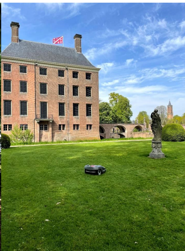
Duurzamer en mooier gazonbeheer door maairobots