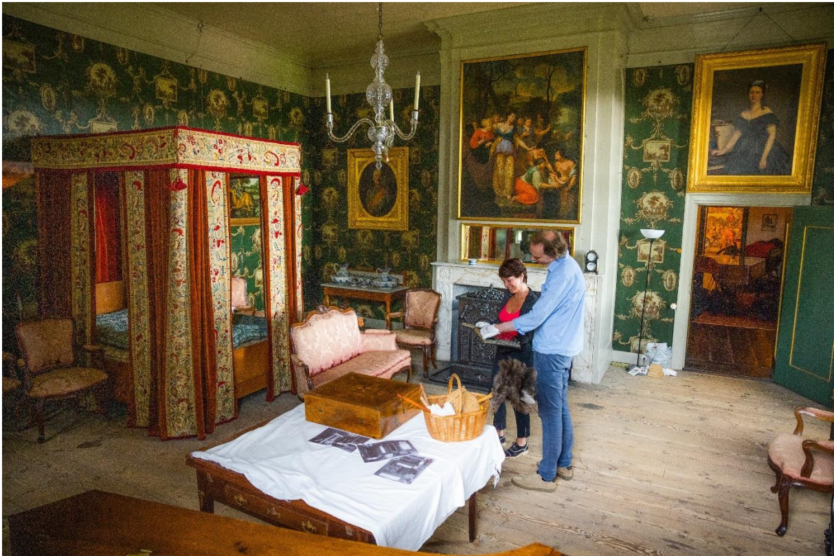
Fotoshoot inrichting 'Fraay Huys' voor de krant.