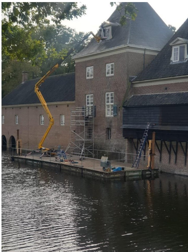
Schilderen en restaureren aan de waterzijde