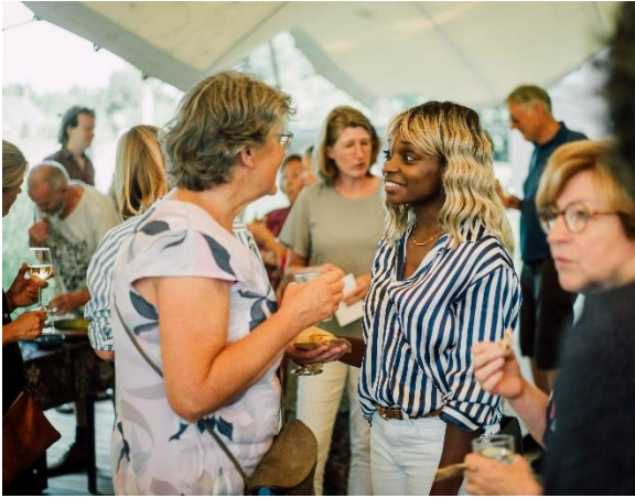
Tijdens de seizoensborrels ontmoeten alle werkgroepen elkaar en praten bij met hun collega's