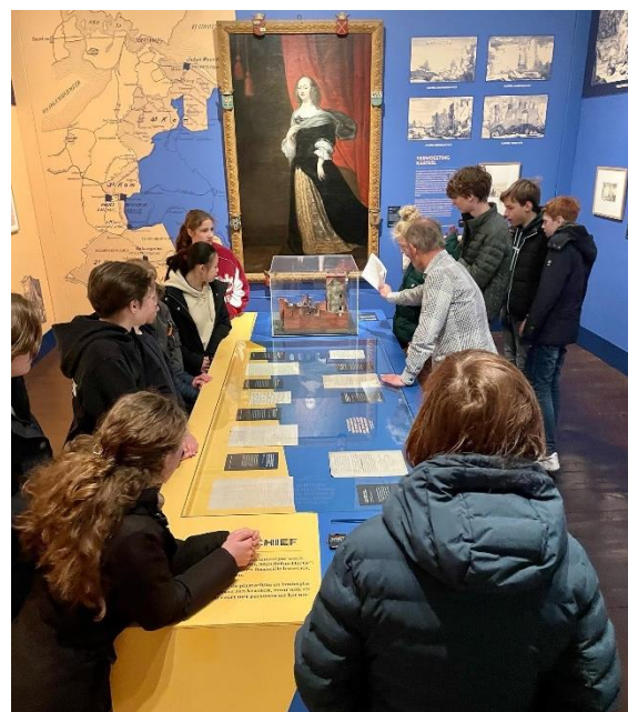
Middelbare scholieren krijgen uitleg over het 'Rampjaar' 1672-73

In 2022 ontwikkelden Slot Zuylen en de kastelen Amerongen en Middachten een educatief programma over het Rampjaar 1672 voor de onderbouw van het voortgezet onderwijs. In april 2023 volgden 160 leerlingen van het Revius Lyceum Doorn dit programma, met als doel hen kennis te laten maken met de betekenis en impact van het Rampjaar voor de bewoners van de kastelen en hun omgeving.