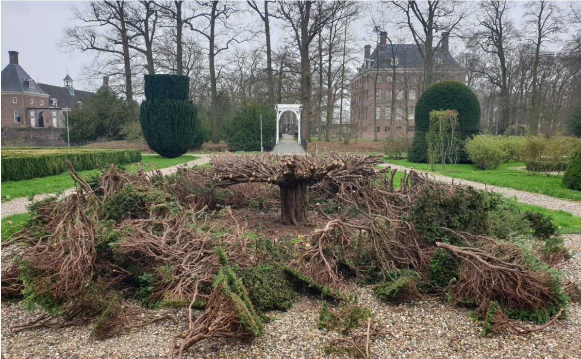
De taxuſtafel van ruim een eeuw oud werd weer teruggesnoeid naar zijn oorspronkelijke vorm. De bijbehorende halfronde witte pergola-bank is middels crowdfunding en fondsen gefinancierd en in 2024 gereed.