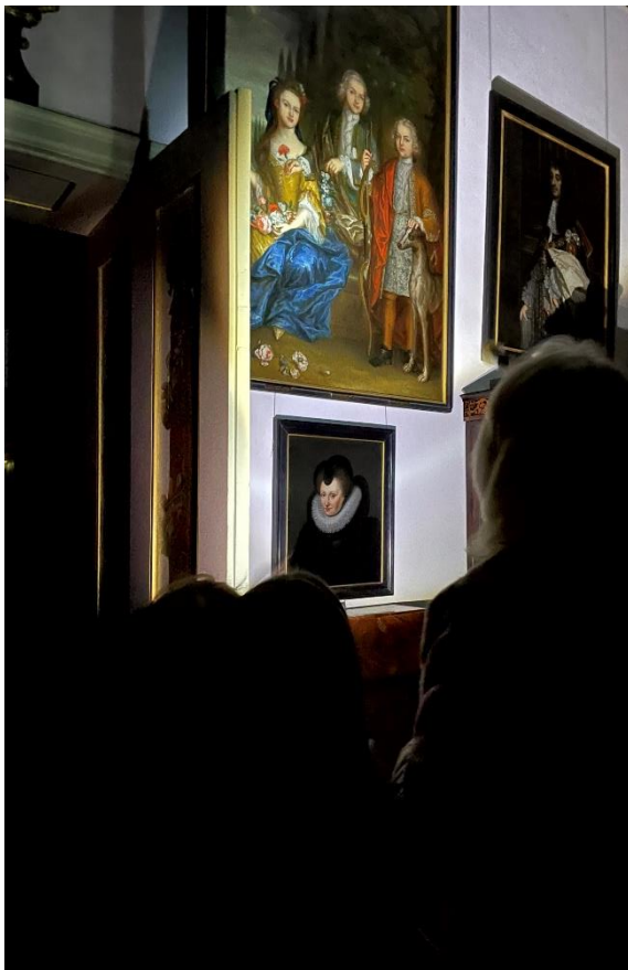
Met een zaklamp door het pikdonkere kasteel. Altijd een succes bij kinderen