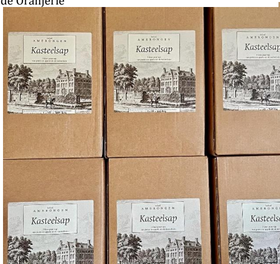
Sap van de appels en peren uit de kasteeltuin