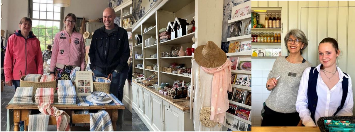
Lievegoed-zorggroep weefde uniek keukenlinnen.