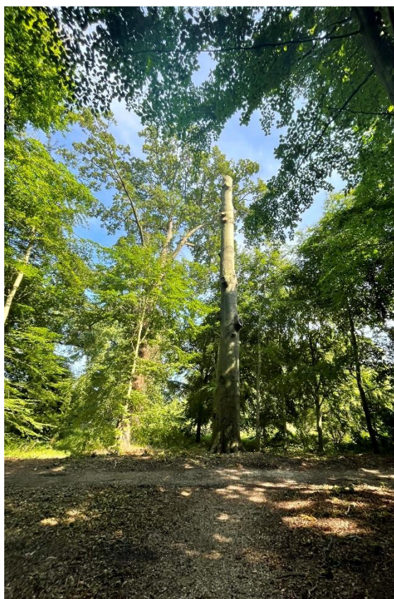
Grote beuk met beukenzwam gekandelaberd voor behoud van organismen