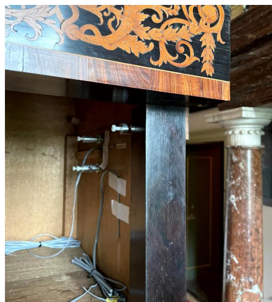
Het eeuwenoude Van Mekerenkabinet vol met meet-sensoren voor het 'Climate4wood' project