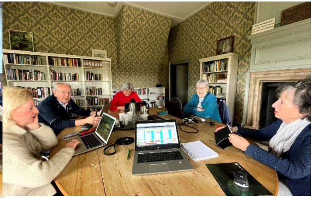
Af en toe vergaderen is voor sommige werkgroepen essentieel.