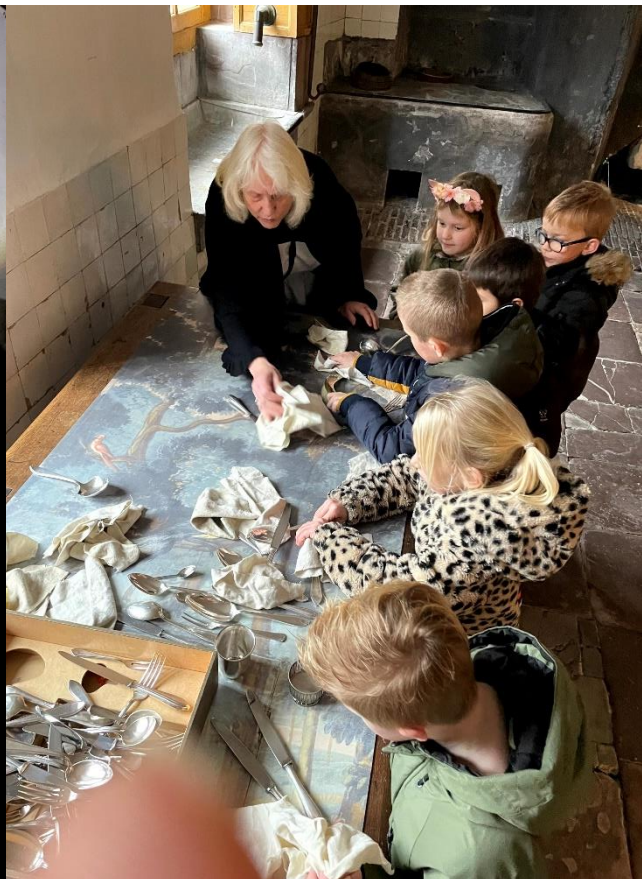
Schoolklassen ontdekken praktische vaardigheden tijdens de diverse schoolprogramma's van de educatie-vrijwilligers