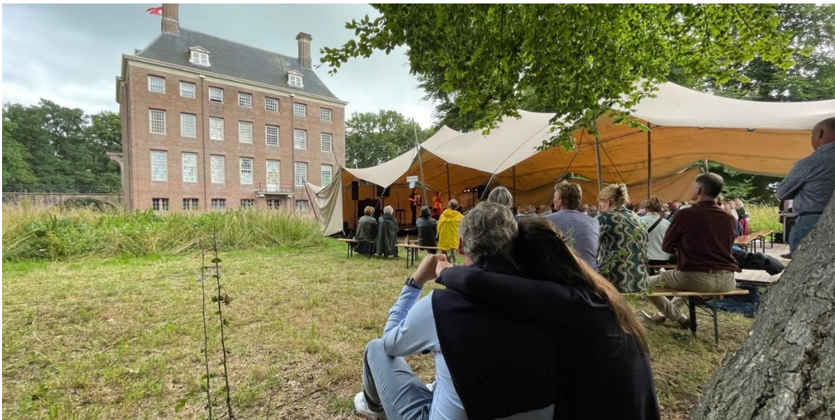
Concerten in het Zomerpaviljoen en op de Galerij van het Huys waren steeds snel uitverkocht