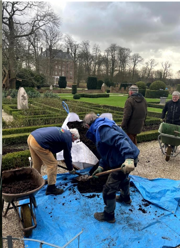
In de ſiertuin wordt het hele jaar gewerkt. Op maandag, woensdag en vrijdag zijn vrijwilligers in de weer.