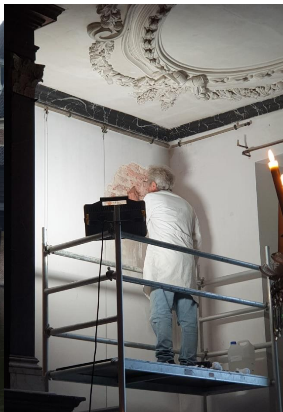
Specialistisch kalkstucwerk door Delmotte